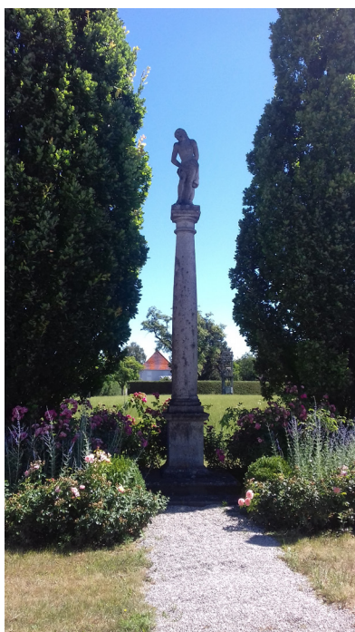
Jesus an der Geißelsäule